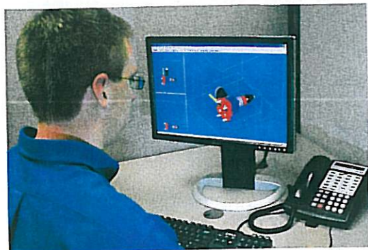
Datenimport. Vor dem Ausdruck wird das 3-D-Modell in die ZPrint-Software importiert. Diese überprüft, ob sich das Modell für den 3-D-Druck eignet.