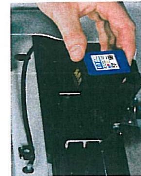
Farbe. Die Tinte kommt aus gewöhnlichen Druckerpatronen.