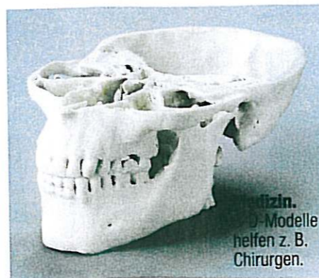
Medizin. 3-D-Modelle helfen z. B. Chirurgen.

Alles in 3-D. Modelle dreidimensional und in Farbe ausdrucken: E-Biz präsentiert die neue Welt des 3-D-Druckens!