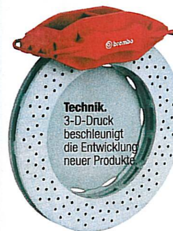
Technik. 3-D-Druck beschleunigt die Entwicklung neuer Produkte.

Von der ersten Idee bis zu einem greifbaren Produkt ist es in der Industrie ein langer Weg. Egal ob es sich um Werkzeuge, Schuhe, Haushaltsgeräte oder andere Gegenstände handelt, die Hersteller tüfteln unentwegt an neuen Konstruktionen und Designs. Das neue Produkt wird skizziert, gezeichnet und am Computer konstruiert. Und weil ein ausgedrucktes zweidimensionales Bild immer nur eine ungenügende Vorstellung liefern kann, wurde bisher meist in langer, mühevoller Arbeit ein 3-D-Modell gebastelt.