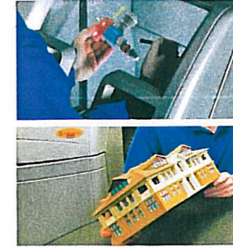
Finish. Letzte Pulverreste werden per Luftdruck entfernt.