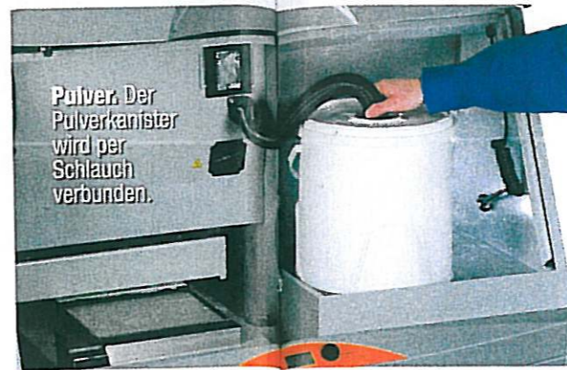
Pulver. Der Pulverkanister wird per Schlauch verbunden.