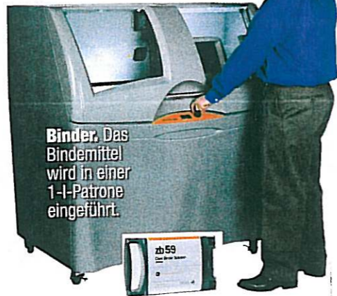
Binder. Das Bindemittel wird in einer 1-l-Patrone eingeführt.