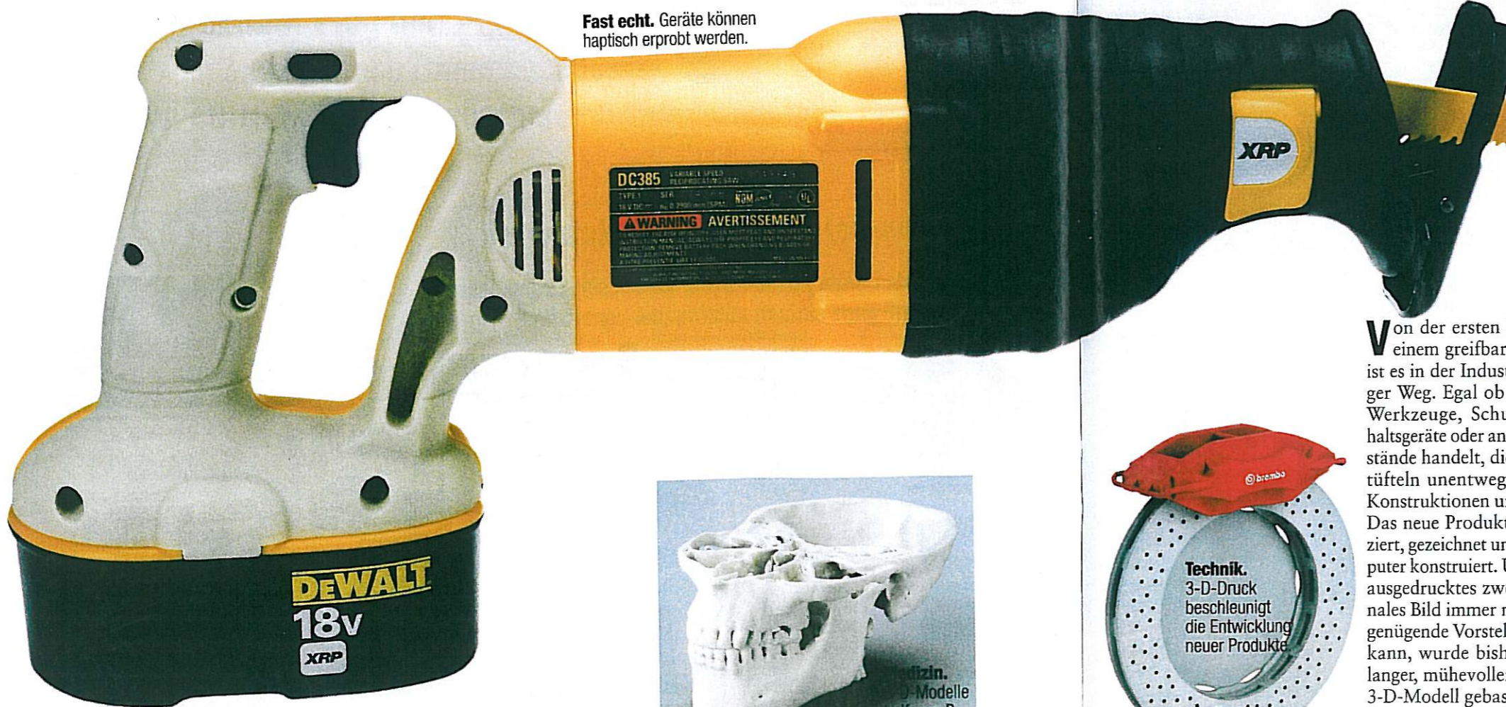
Fast echt. Geräte können haptisch erprobt werden.

Alles in 3-D. Modelle dreidimensional und in Farbe ausdrucken: E-Biz präsentiert die neue Welt des 3-D-Druckens!